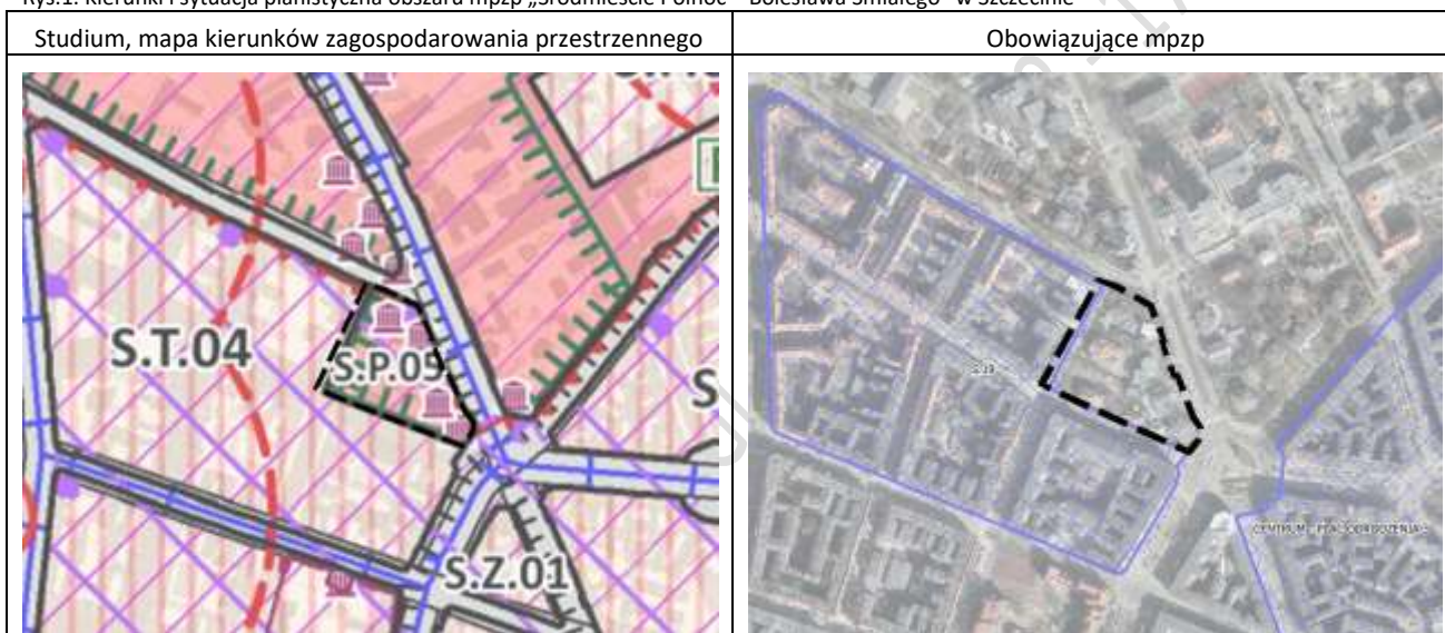
Rys.1. Kierunki i sytuacja planistyczna obszaru mpzp „Śródmieście Północ – Bolesława Śmiałego” w Szczecinie

Źródło: Opracowanie na podstawie materiałów BPPM.