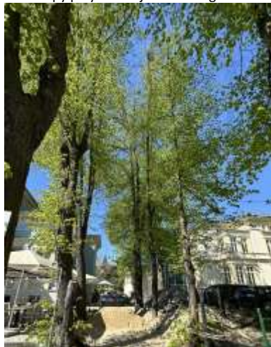
Fot.1. Lipy przy Al. Wojska Polskiego 66