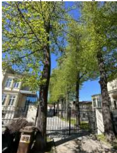
Fot.2. Lipy przy Al. Wojska Polskiego 68